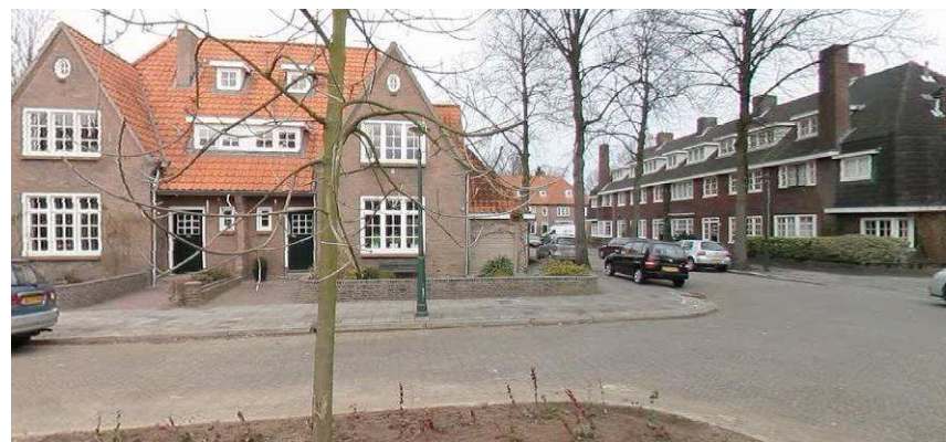
Haviklaan, Gaailaan, architect Kooken en Wolters