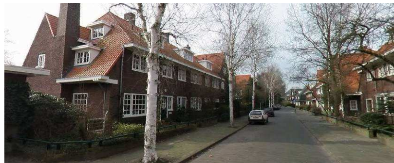
Lijsterlaan, architect Hanrath