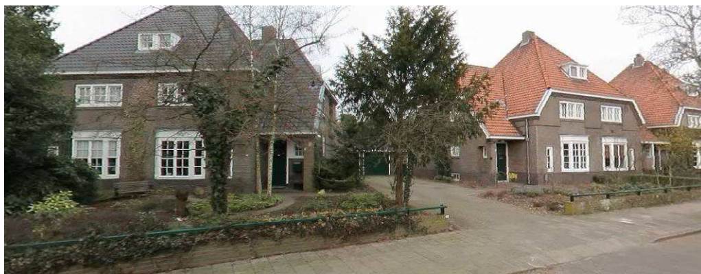
Uiverlaan, architect De Bazel